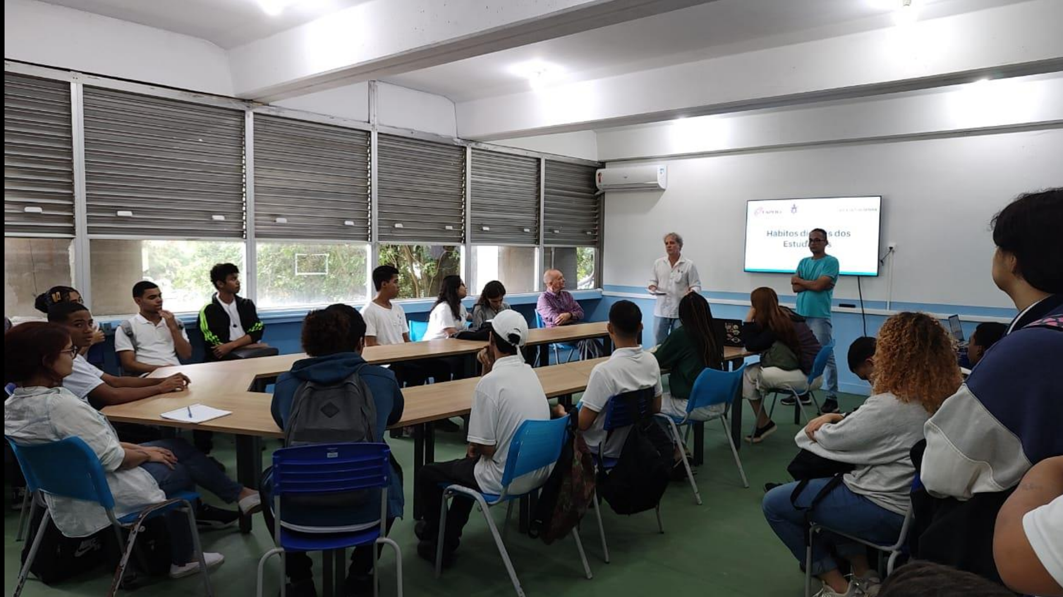
Primeira apresentação dos dados da pesquisa de campo no CIEP