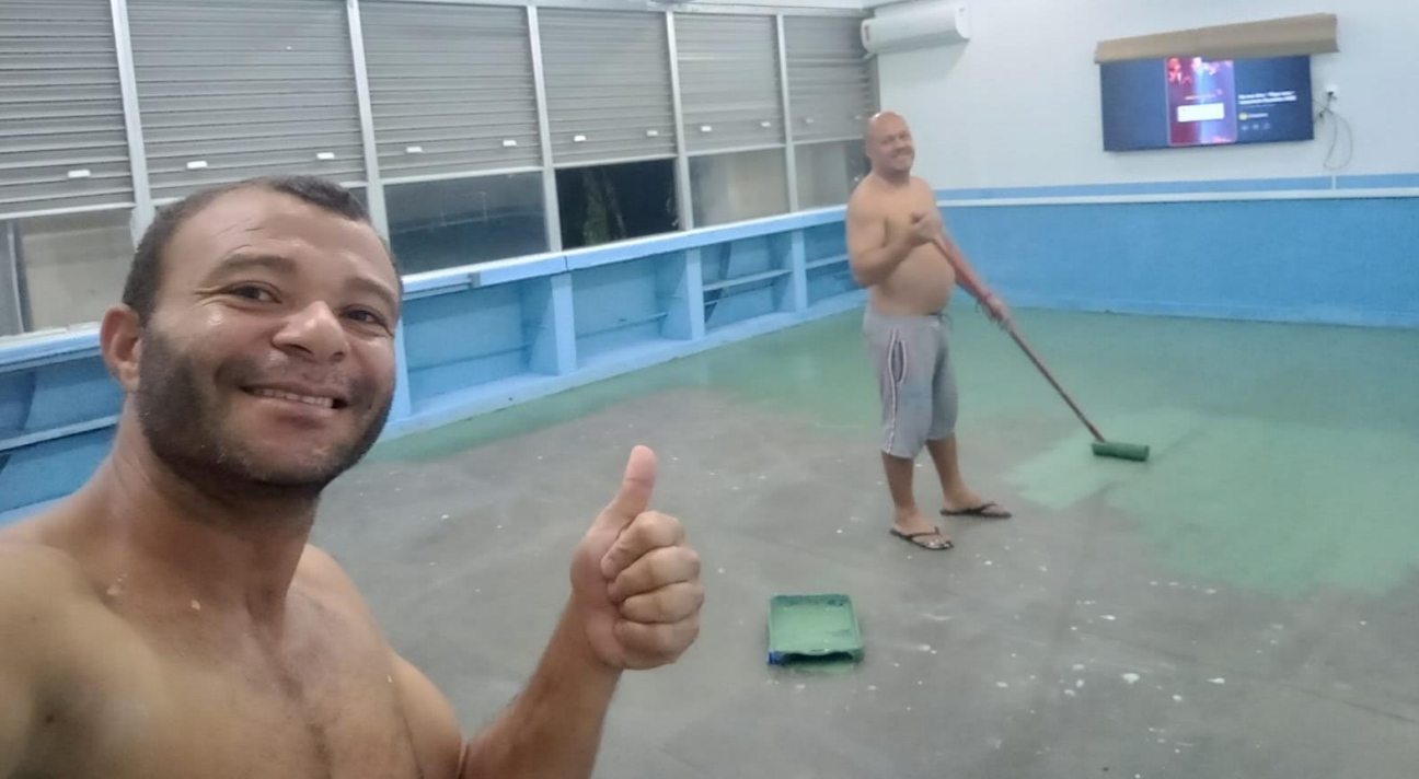
Instalação da TV, reforma do mural e mutirão de pintura do sala pela comunidade escolar