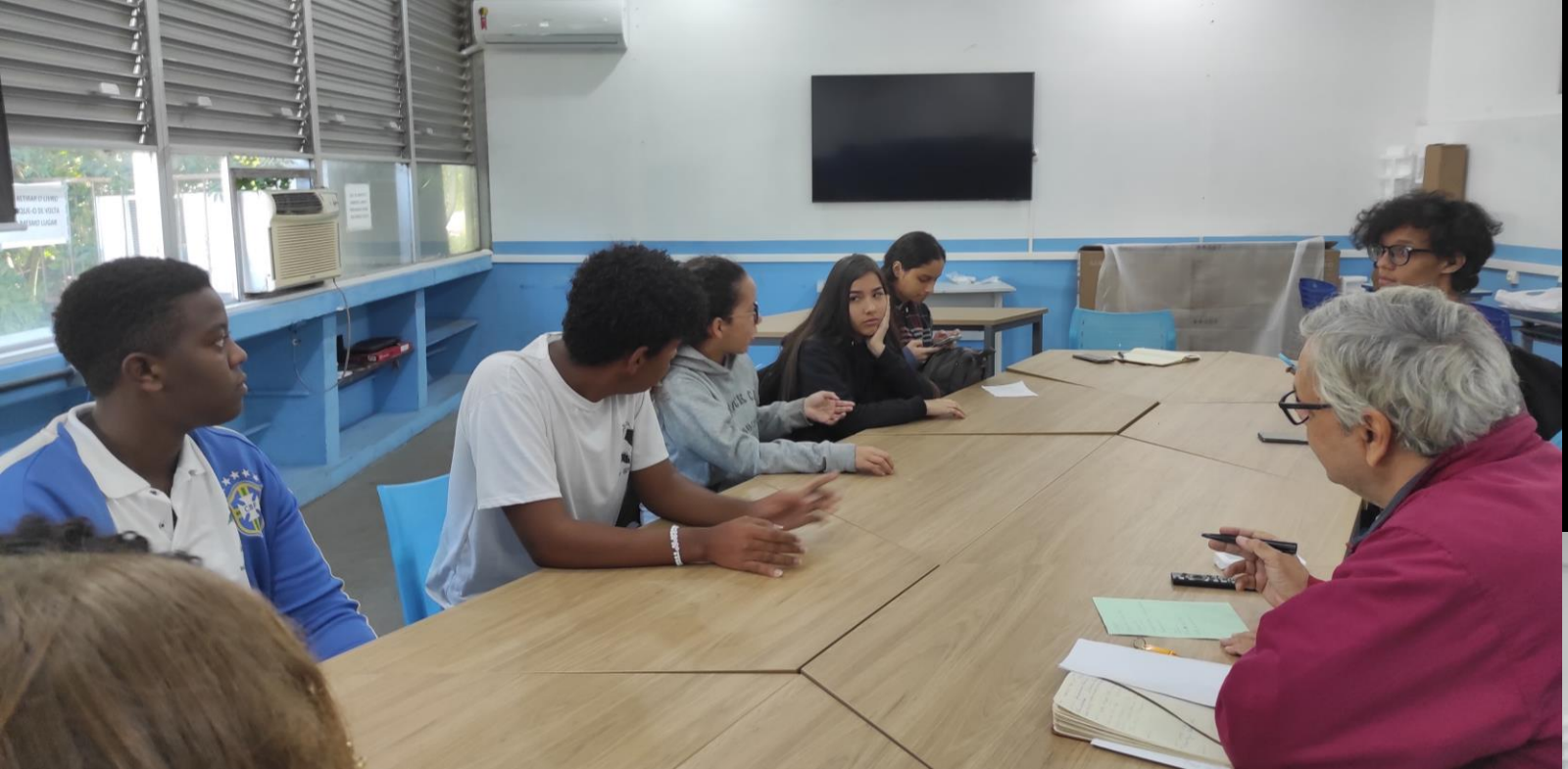
Reunião na sala nova com os alunos do Grêmio escolar (manhã)