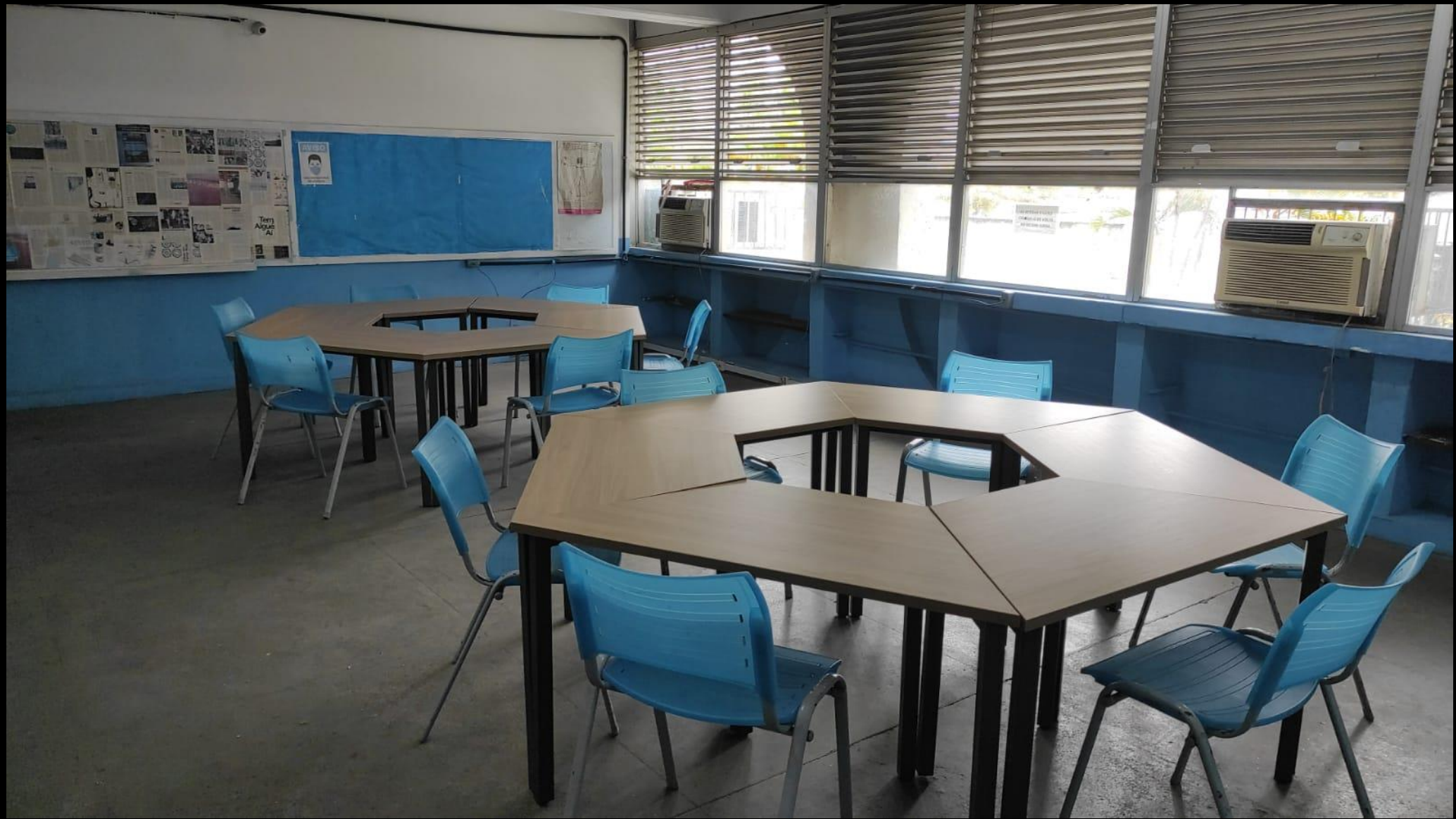
Primeira arrumação das mesas na sala