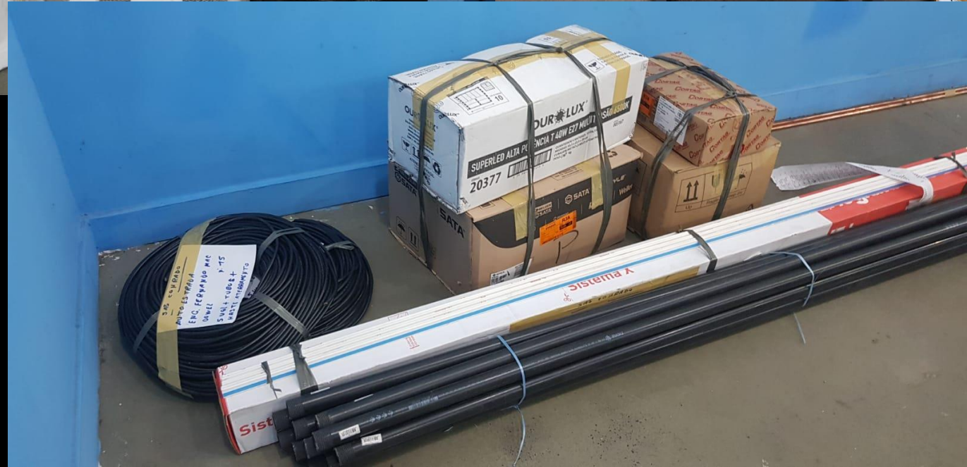
Materiais e chave da sala