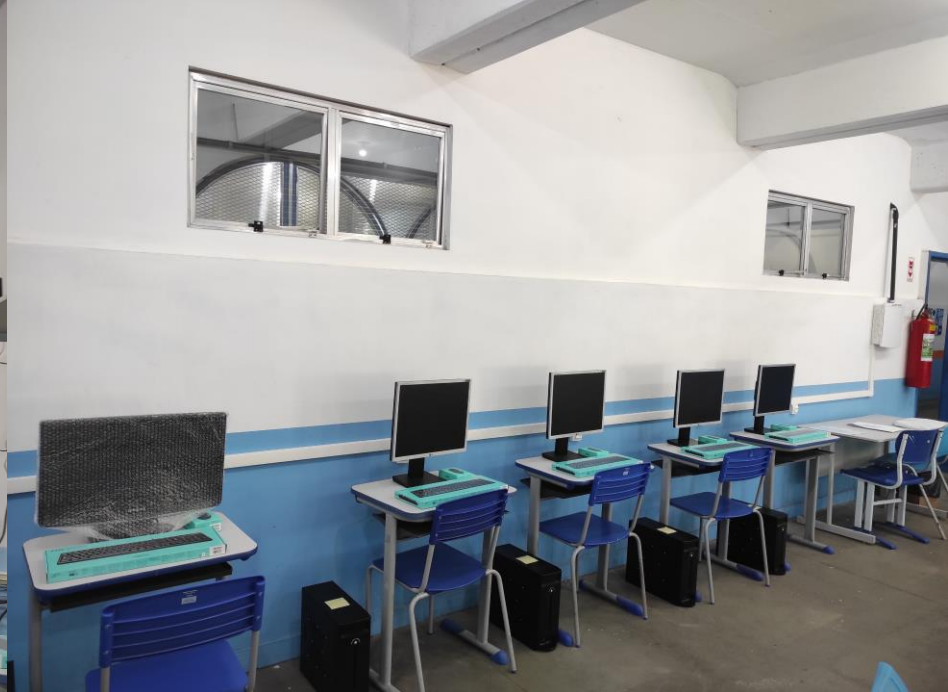
Cabeamento dos desktops doados pelo Laboratório de Informática da PUC-Rio